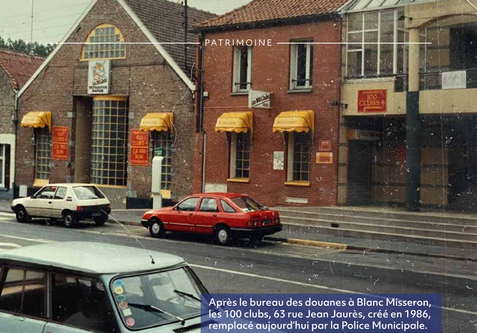
Après le bureau des douanes à Blanc Misseron, les 100 clubs, 63 rue Jean Jaurès, créé en 1986, remplacé aujourd'hui par la Police Municipale.