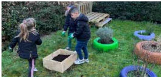
Atelier jardinage pour les enfants des mercredis kids sous l'encadrement des animateurs du pôle cohésion sociale.