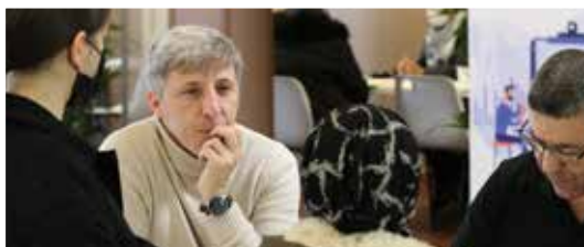
Les rendez-vous de l'emploi pour les locataires SIGH en partenariat avec le CCAS de la ville, Pôle Emploi et le PLIE.