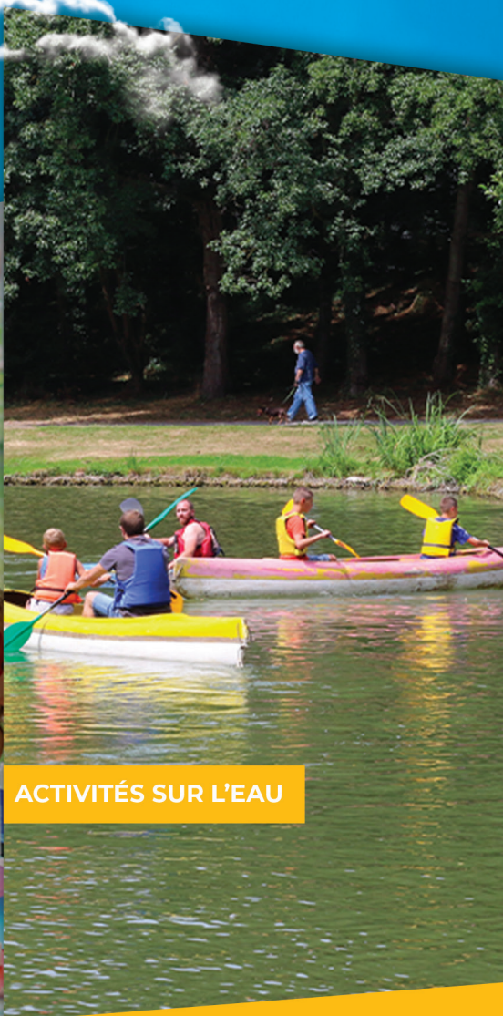
ACTIVITÉS SUR L'EAU