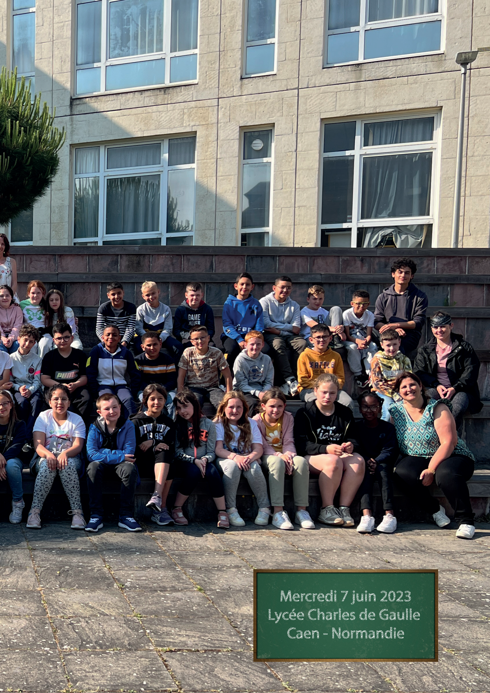
Mercredi 7 juin 2023 Lycée Charles de Gaulle Caen - Normandie