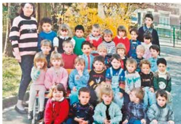
Ecole maternelle Guy Morelle 1993