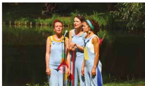
De Liszt aux chants régionaux, "le pianO du lac" nous a transporté entre deux averses au parc de l'Aunelle accompagné par l'école de musique à l'occasion de la fête de la musique.