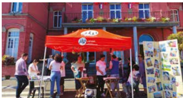
Opération de communication pour le Conseil Citoyen à l'occasion du marché hebdomadaire de la ville.