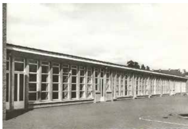
Ancienne école des garçons en 1986 école du Caos

Merci à « Si Quiévrechain m'était conté », David El Hassan, pour le prêt de ces illustrations.