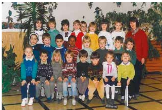
Ecole maternelle Guy Morelle 1993 Photo de M me « Pomme Coco »