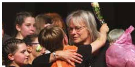
Le remake d'High School Musical a fait une halte à Quiévrechain grâce à l'école municipale de musique. Ce spectacle vient conclure une année de travail et de répétitions pour les membres de l'école.