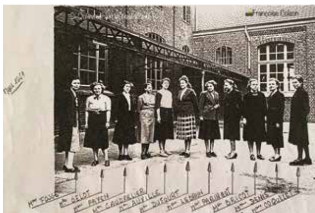
Ecole de la Mairie 1951 – institutrices.