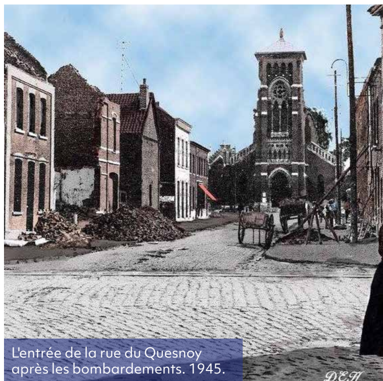
L'entrée de la rue du Quesnoy après les bombardements. 1945.

L'exposition que propose la bibliothèque retrace l'histoire de l'écriture. Un speed dating sur les métiers ferroviaires. Des petites énigmes seront proposées... à vous de jouer ! Des ateliers ludiques attendent également les enfants. Lieu : Bibliothèque Municipale, rue de l'Hôtellerie, de 14h à 18h, samedi 18 et dimanche 19 septembre.