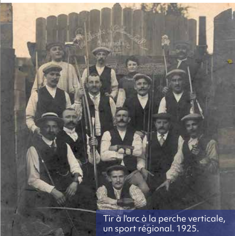
Tir à l'arc à la perche verticale, un sport régional. 1925.

Après une année marquée par la fermeture des établissements accueillant du public partout en France et en Europe, la 38 e édition des Journées Européennes du Patrimoine offre à tous une occasion de se rassembler. Son esprit inclusif invite chacun à fêter la richesse de notre patrimoine national.