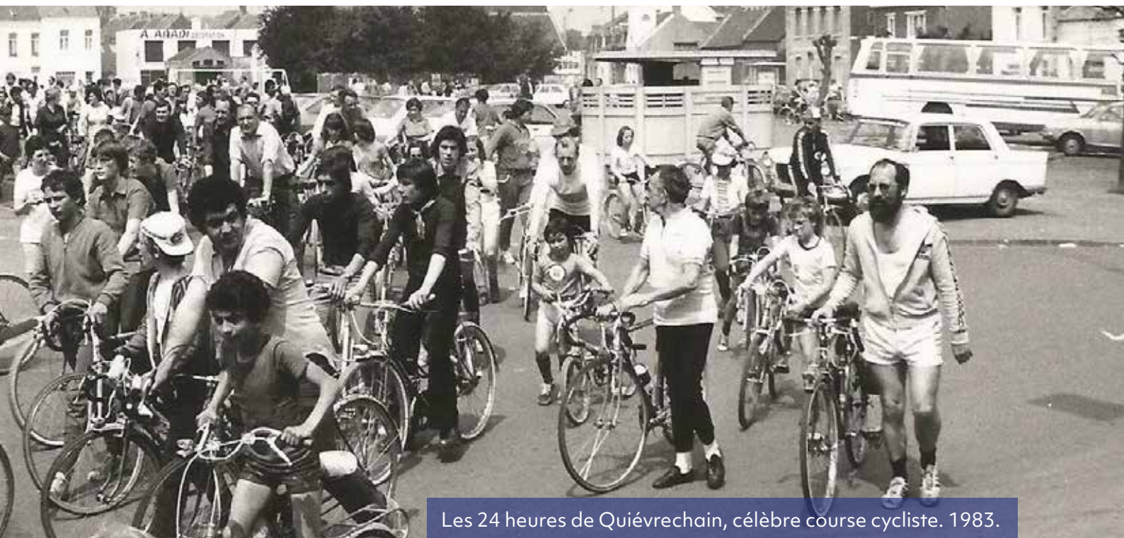
Les 24 heures de Quiévrechain, célèbre course cycliste. 1983.

Les 18 et 19 septembre prochains ont lieu les journées du patrimoine, avec pour thème « Patrimoine pour tous ». Un focus particulier est mis sur le patrimoine ferroviaire, témoin de l'histoire du rail dans notre pays. Découvrez le programme concocté par les associations Quiévrechinoises et votre ville !