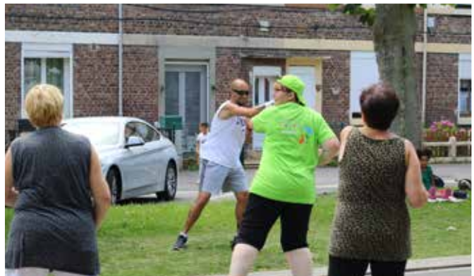
Cours de zumba, organisé par le Centre Social Amilcar Reghem en juillet dernier.