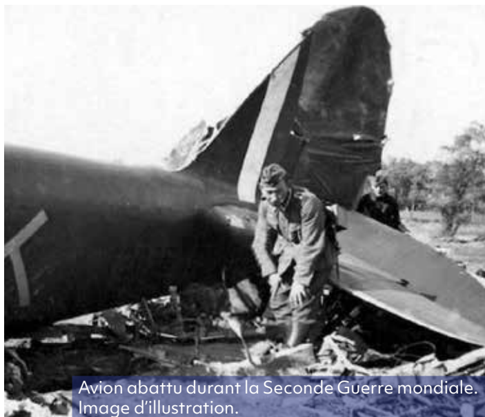
Avion abattu durant la Seconde Guerre mondiale. Image d'illustration.